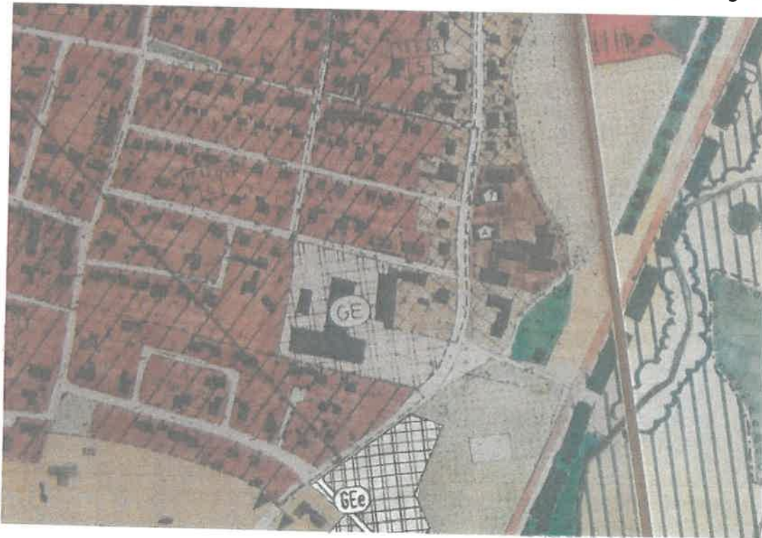
Auszug aus dem Flächennutzungsplan M 1: 5000

Das Änderungsgebiet ist im derzeit rechtskräftigen Flächennutzungsplan als Allgemeines Wohngebiet dargestellt. Die Planung ist somit aus dem Flächennutzungsplan entwickelt. Nördlich und südöstlich davon befinden sich Gewerbegebiete, östlich eine Sportanlage und westlich ein Allgemeines Wohngebiet.