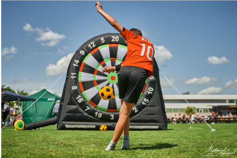
BU: Beim Jugend- und Familienfest tagsüber gibt es jede Menge Spiel, Workshops und vieles mehr zum Mitmachen für Kinder und Jugendliche.