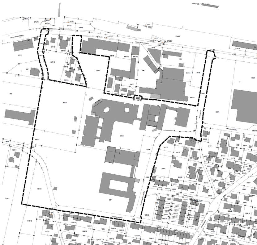
Voraussichtlicher Geltungsbereich nach Beschluss