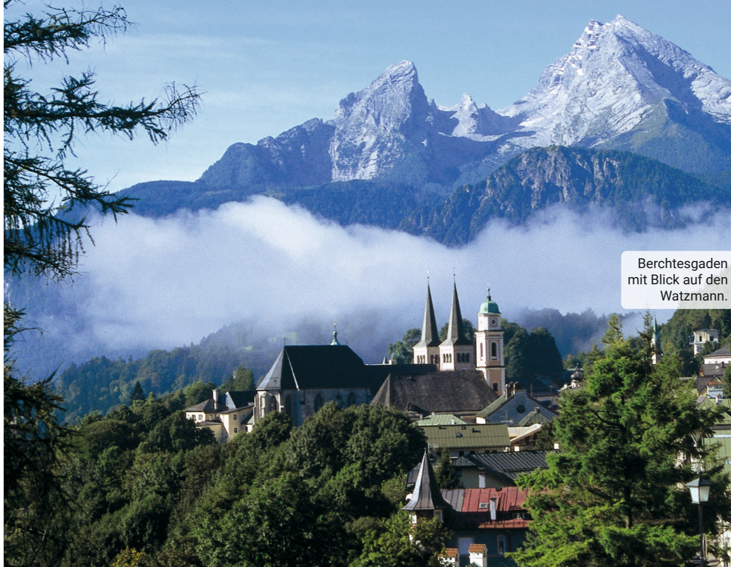
Berchtesgaden mit Blick auf den Watzmann.

umliegenden Bergen und Seen: von Watzmann und Königssee mit St. Bartholomä bis hin zu weltbekannten österreichischen Skigebieten und den Salzkammergut-Seen. Ebenfalls nahe liegend sind attraktive Sehenswürdigkeiten wie Burghausen mit der längsten Burganlage der Welt so wie der Chiemsee mit der Fraueninsel und dem Schloss Herrenchiemsee von König Ludwig II. Auch in die Landeshauptstadt München ist es nur eine gute Stunde Autofahrt.